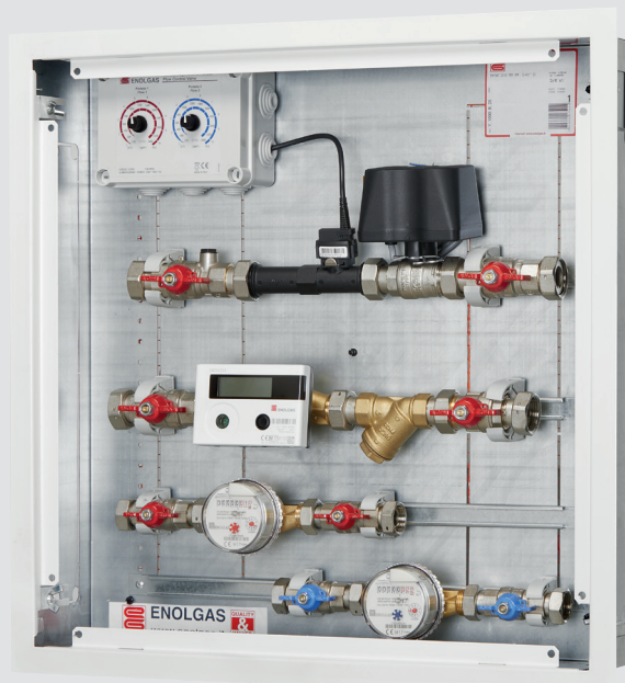
Art. Y5090B20 - MODULO DI CONTABILIZZAZIONE CON REGOLAZIONE DI PORTATA

Energy • Sat è un sistema evoluto e flessibile per la contabilizzazione del consumo di gas in impianti centralizzati che unisce al risparmio di un impianto centralizzato il comfort di un impianto termoautonomo.