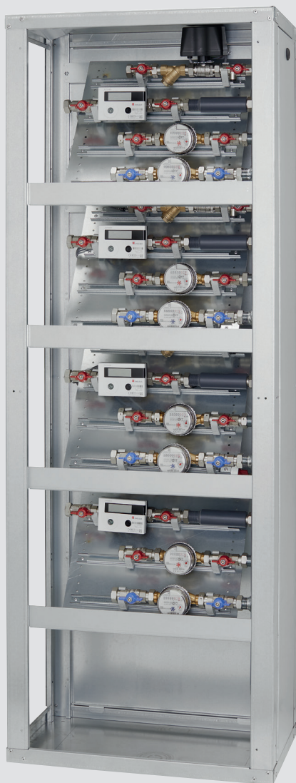
Art. Y5052X05 - MODULO DI CONTABILIZZAZIONE 4 UTENZE

Energy • Sat è un sistema evoluto e flessibile per la contabilizzazione del consumo di gas in impianti centralizzati che unisce al risparmio di un impianto centralizzato il comfort di un impianto termoautonomo.